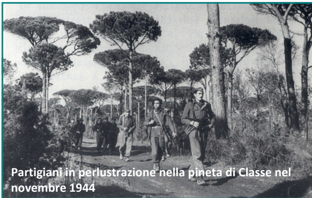
Partigiani in perlustrazione nella pineta di Classe nel novembre 1944

Il Distaccamento Partigiano, congiuntamente con la P.P.A., il 27° Lancieri e lo Squadrone 2721 del RAF Regiment, partecipò con piccoli nuclei alle operazioni militari su Fosso Ghiaia e Classe Fuori, liberate rispettivamente il 12 e il 19 novembre 1944.